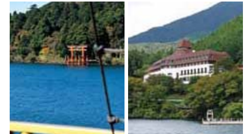
箱根神社水中鳥居